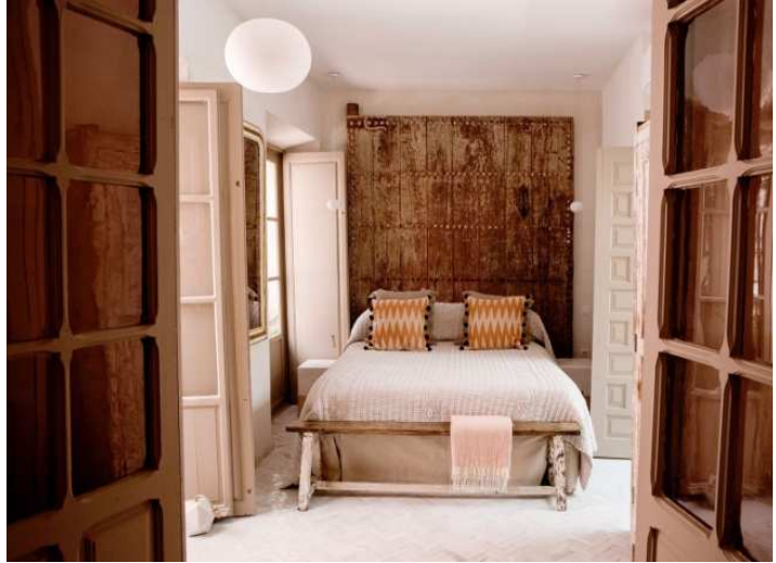
Figura 2. Vivienda unifamiliar. Sevilla