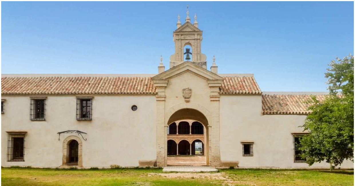
Figura 5. Cortijo Andaluz

Nuestras fichas técnicas son redactadas conforme a nuestros mejores conocimientos técnicos y prácticos. No siendo posible intervenir en las condiciones de las obras y en la ejecución de las mismas, citadas informaciones representan indicaciones de carácter general que no comprometen en modo alguno a CUMEN S.L. Nuestra empresa aconseja una prueba preventiva para verificar la idoneidad del producto para su uso preventivo. Las instrucciones de forma de uso se hacen según nuestros ensayos y conocimientos y no liberan al consumidor del examen o verificación de los productos para su correcta utilización. La empresa o persona encargada de usar nuestro material deberá establecer si su empleo es adecuado o no, pues asume la responsabilidad que pueda derivar de su uso. Nuestros productos están evaluados mediante ensayos iniciales de tipo, EIT determinando que son conformes con los requisitos de la norma UNE-EN_998-1:2010 (Norma Europea) y que la declaración de prestaciones representa el verdadero comportamiento del producto. Los ensayos iniciales de tipo permanecerán válidos para productos posteriores mediante el control de producción en fábrica integrado, CPF, fichas técnicas y ensayos realizados en laboratorios inscritos en el registro general de Laboratorios de Ensayos del Ministerio de la vivienda.