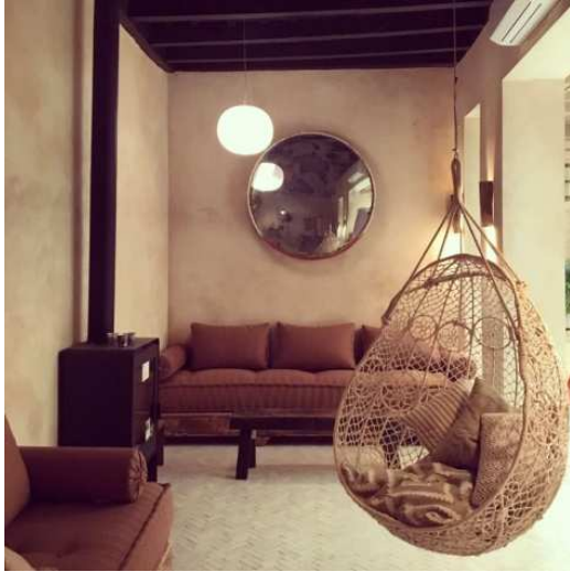
Figura 1. Vivienda unifamiliar. Sevilla