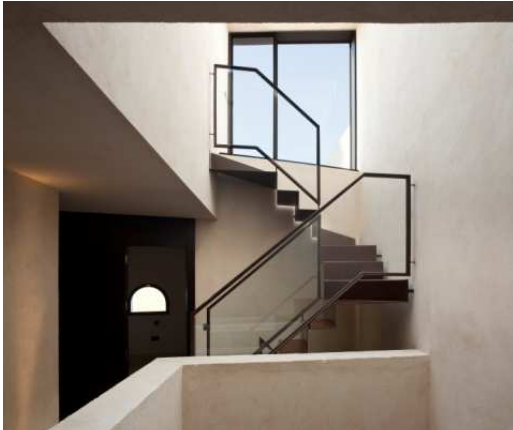
Figura 3. Vivienda unifamiliar. Sevilla