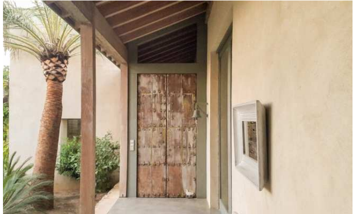
Figura 4. Vivienda unifamiliar. Vivienda en el Mediterráneo